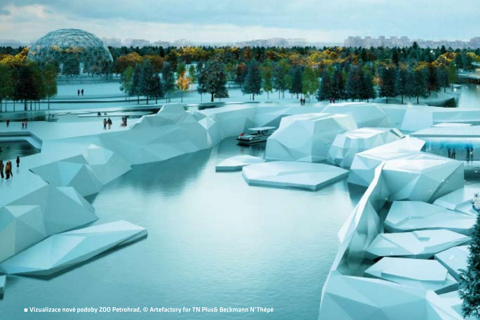
■ Vizualizace nové podoby ZOO Petrohrad, © Artefactory for TN Plus & Beckmann N'Thépé

pod ni. Nově vzniklá klidová zóna dodává bohatým průčelím obráceným k vodě zpět jejich původní smysl, zpomaluje dopravu, takže se kanály namísto frekventovaných tepen stávají místem k sociální komunikaci. Těžko říct, co by tempu z dob, kdy byly gondoly jediným dopravním prostředkem, řekli obchodníci, místní obyvatelé by ho však možná uvítali. Už proto, že podmínkou pro přijetí každého z 201 obdržných návrhů bylo použití ekologicky šetrných a zároveň moderních technologií, tudíž se nepředpokládá velká zátěž na okolní prostředí. Místní vládní instituce i developéři tak v soutěži získali inspiraci pro budoucí vizi města, což je ostatně jedním z hlavních cílů portálu CityVision. V tištěné podobě si soubor všech předložených návrhů lze prohlédnout ve speciálním čísle exkluzivního časopisu Cityvisionmag 4.